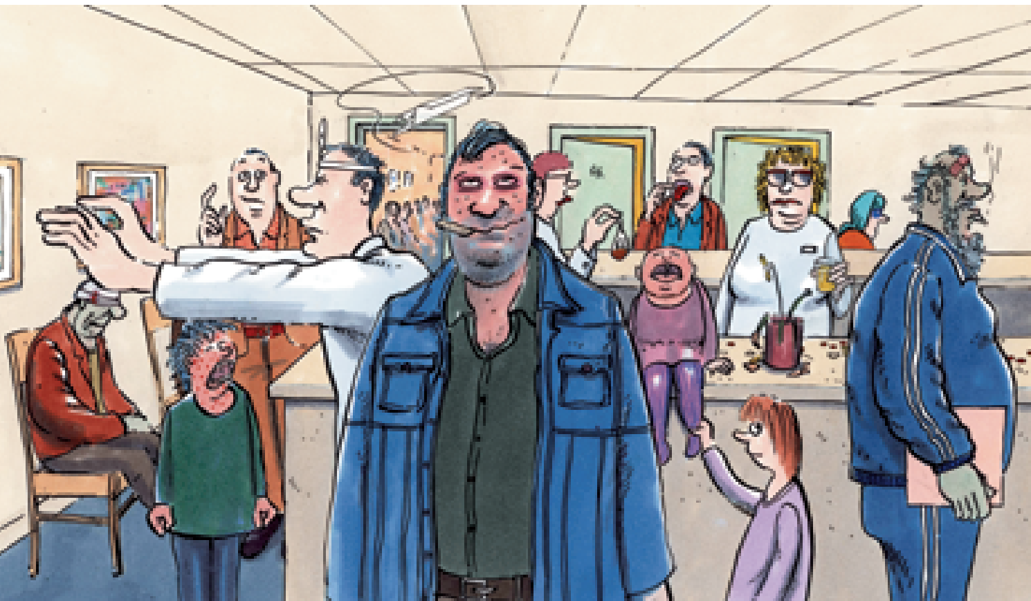
Montagmorgen in der Hausarztpraxis

Das Frankfurter Fehlerberichts- und Lernsystem für Hausarztpraxen